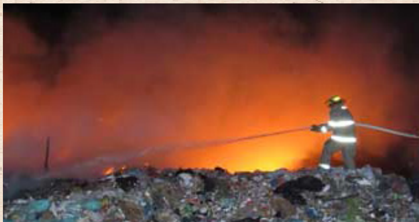
Incendio en Basurero Ciudad Valles, San Luis Potosí