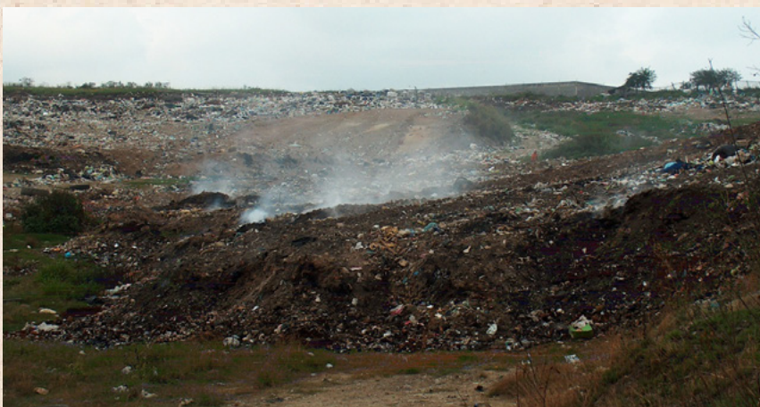
Incendio en Relleno Sanitario Ébano, San Luis Potosí