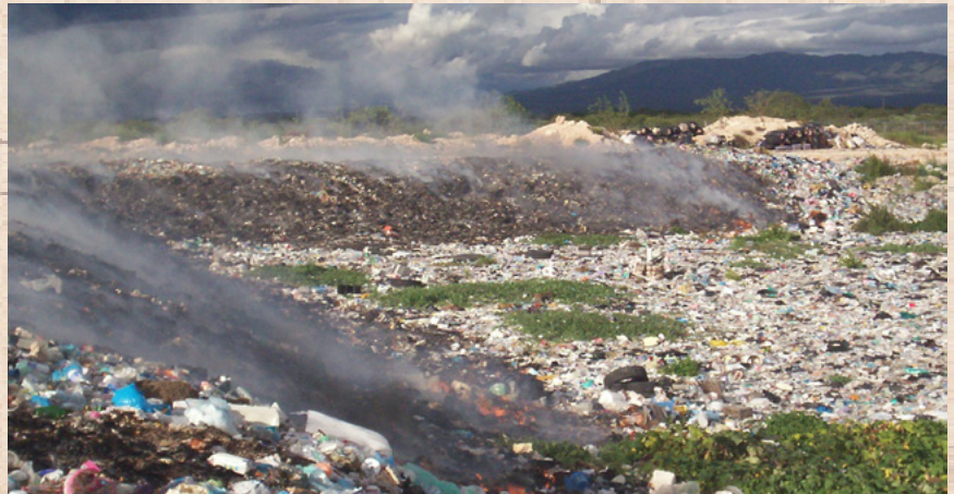
Incendio en Relleno Sanitario Venado, San Luis Potosí