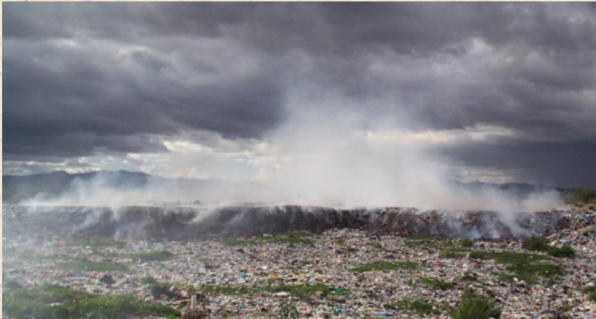
Incendio en Relleno Sanitario Venado, San Luis Potosí